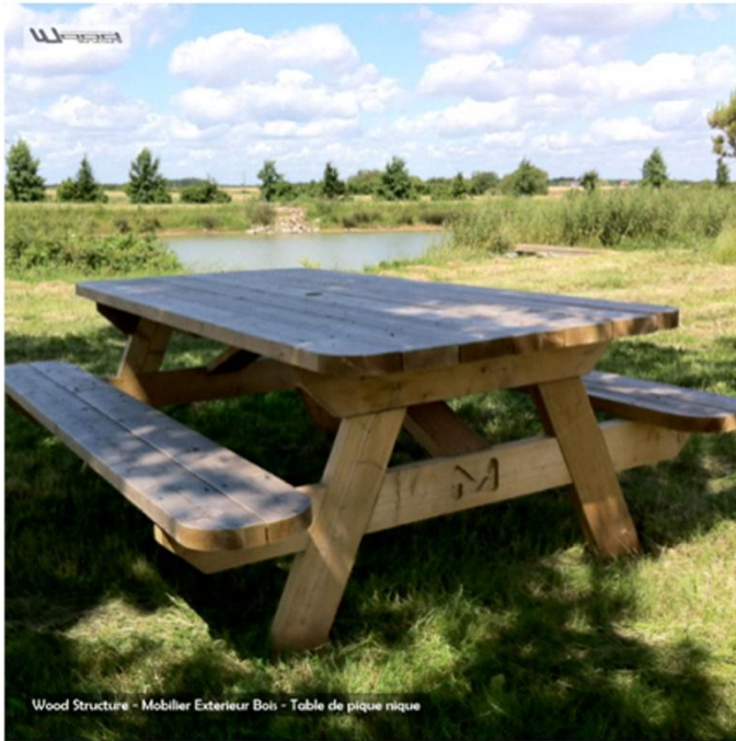
Table de pique nique